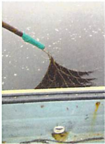
網に付いている 海苔