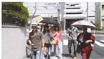
須磨海浜公園駅から出発

それより何よりびっくりしたことは、思ったよりやって、 とても楽しかったということです。 もともと継続してするつもりでしたが、逆に病みつきに なりそうです。