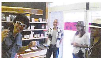
店にもどって一服