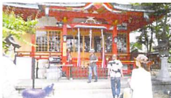
網敷天満宮におまいり